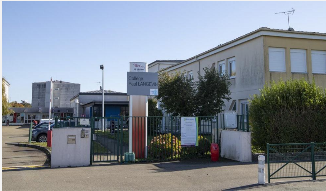
Collège Paul Langevin d'Evron